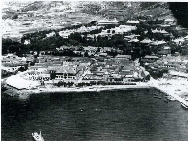
俯瞰爱德华码头，摄于1920年代。

本年度总收入达164,973.39元（洋元，下同），支出达235,445.36元。同时英帝 国基金拨补助金20,000英镑，按照各种兑换率转换成当地货币合计129,596.83元。本租借地1901-1902年度划归殖民部管理时，年收入达20,000元，开支120,000元，此外拨款达11,250英镑。因此，现在的年收入是1901-1902年度的8倍还多，而支出还不到当时的2倍，并且截止到1919-1920年度，平均年度拨款已减至大约6,000英镑。